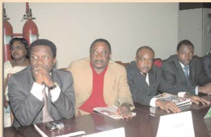
Quelques responsables attentifs

Le MPO vise le caractère participatif de la gestion, la responsabilisation, la négociation des objectifs, l'affectation des ressources, et l'évaluation. obéit à quatre principes : la vision claire et précise de l'objectif global à atteindre, l'atomisation de l'objectif global, l'engagement maximum, la motivation accrue et le contrôle.