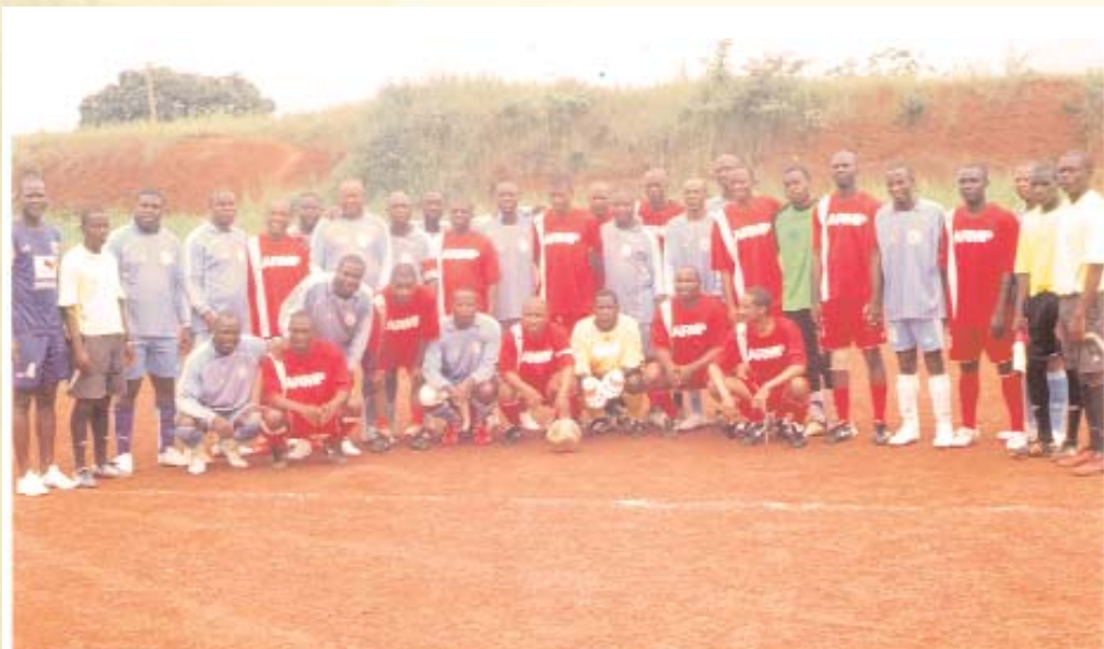
Photo de famille de ARMP F.C