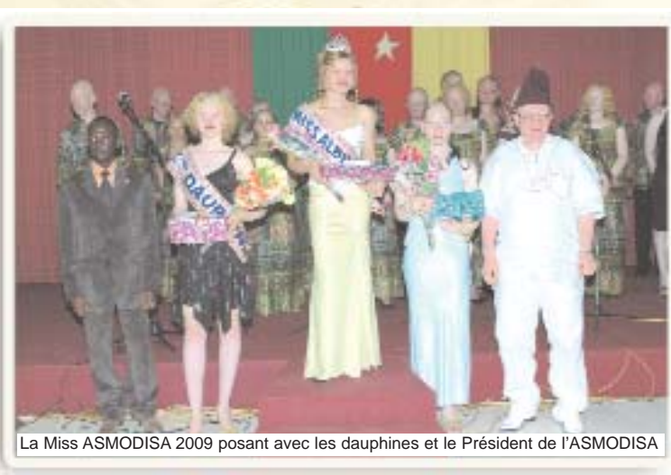
La Miss ASMODISA 2009 posant avec les dauphines et le Président de l'ASMODISA

Consultations médicales gratuites, Table ronde sur les cancers de la peau, Atelier de formation, Match de football, Gala culturel et Culte d'action de grâce, telles sont les